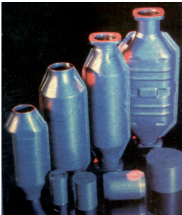
FIG|02| AISI 409 o 439 o type 441 vengono impiegati per i sistemi di scarico.

le diverse tipologie e proprietà, così da delineare le possibilità di utilizzo in taluni settori che, fino ad oggi, sono stati regno incontrastato dei tipi austenitici sopra menzionati.