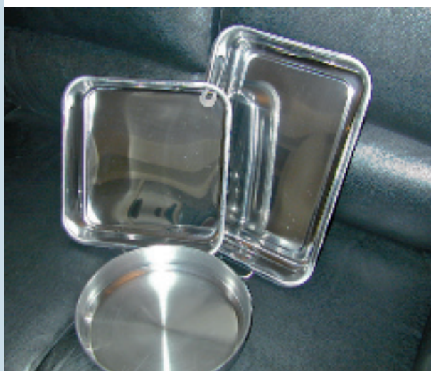
FIG07 Anche nel settore del pentolame l'AISI 430 ha cominciato a sostituire l'AISI 304.

Sulla base di queste semplici considerazioni generali, è abbastanza chiaro che il 444 (1.4521) si delinea come equivalente al 316 in termini di resistenza alla corrosione e quindi valida alternativa più economica in una vastissima gamma